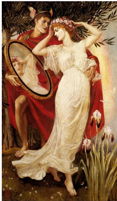
Hermès et Aphrodite par Walter CRANE (1845-1915)

Les mythes sont utilisés comme interrogation, support de réflexion, ouverture, recherche de sens par rapport à nos questionnements actuels.